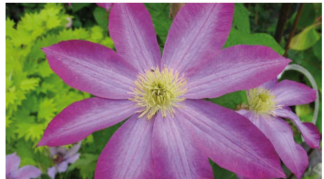
Clematis 'Pink Champagne/Kakio'