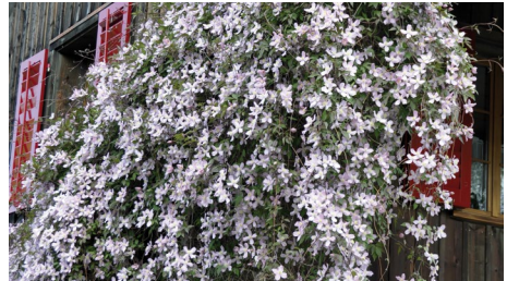
Clematis montana 'Tetrarosa'