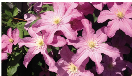
Clematis hybriden 'Comtesse de Bouchaud'