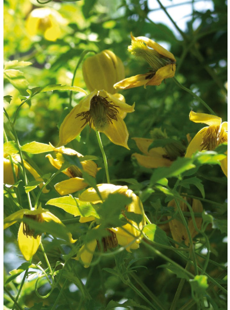
Clematis tibetana var. tangutica 'Golden Tiara' (Schnittkategorie C)