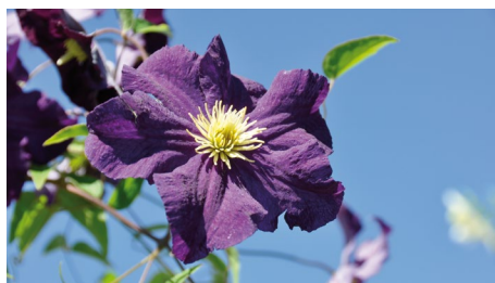
Clematis viticella 'Viola'