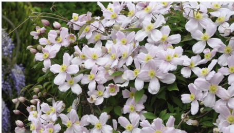
Clematis montana 'Mayleen'