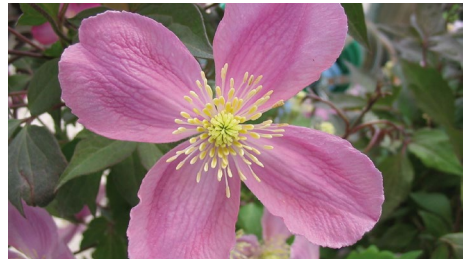
Clematis montana 'Freda'