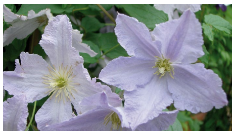
Clematis viticella 'Blekitny Aniol'