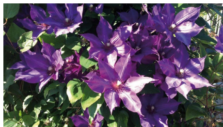
Clematis hybriden 'Jackmannii'