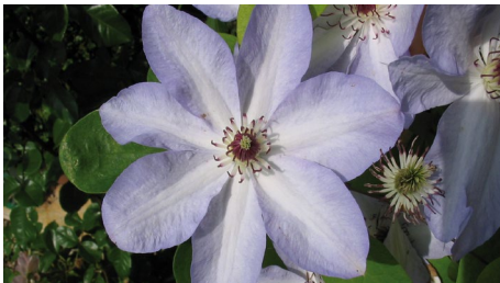
Clematis hybriden 'Ivan Olson'