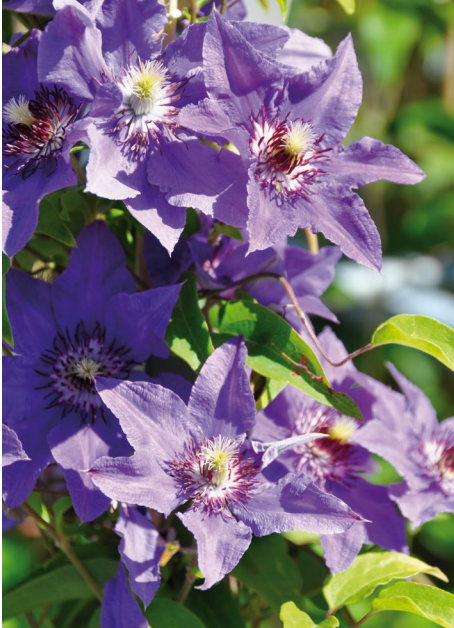
Clematis 'Königskind' (Schnittkategorie B)